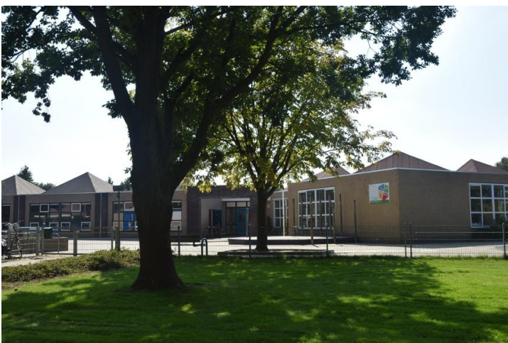
IKC De Hoge Hoeve De Hoge Hoeve 70 6932 DJ Westervoort

Voor de kinderen die ons IKC bezoeken is het van groot belang dat er op het gebied van zorg een doorgaande lijn is. Momenteel werken de partners nog volgens hun eigen zorgstructuur. Uiteindelijk willen we er naar toe dat er een IKC-breed zorgplan komt. Dit is in ontwikkeling. Zie hoofdstuk 4 Zorgstructuur 0-4 jaar.